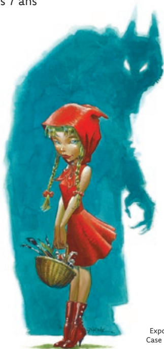
Exposition Case à case